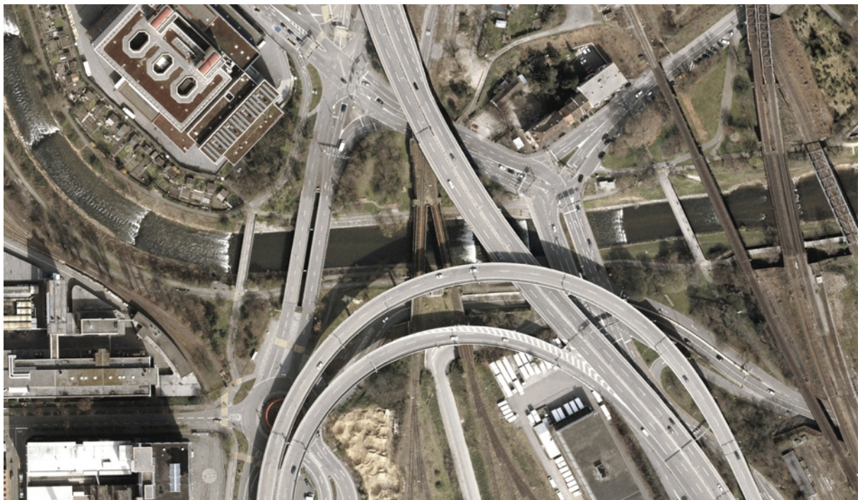
Orthofoto Ausschnitt „RICHARD&HORST“

Nach dieser pionierhaften und zum Teil sehr experimentellen Zwischennutzung folgte Anfang 2004 die mehr auf die benachbarten Quartiere orientierte, sehr breit abgestützte und kooperativ mit Eigentümerin und Kanton entwickelte Zwischennutzung durch die «Vereinigung Interessierter Personen - VIP». Die insgesamt über 75 angeschlossenen Vereine, lokalen Unternehmen und interessierten Einzelpersonen realisierten neue Freiraumangebote wie Infrastruktur für Trendsport, Sonntagsmarkt und Kinderprojekte.