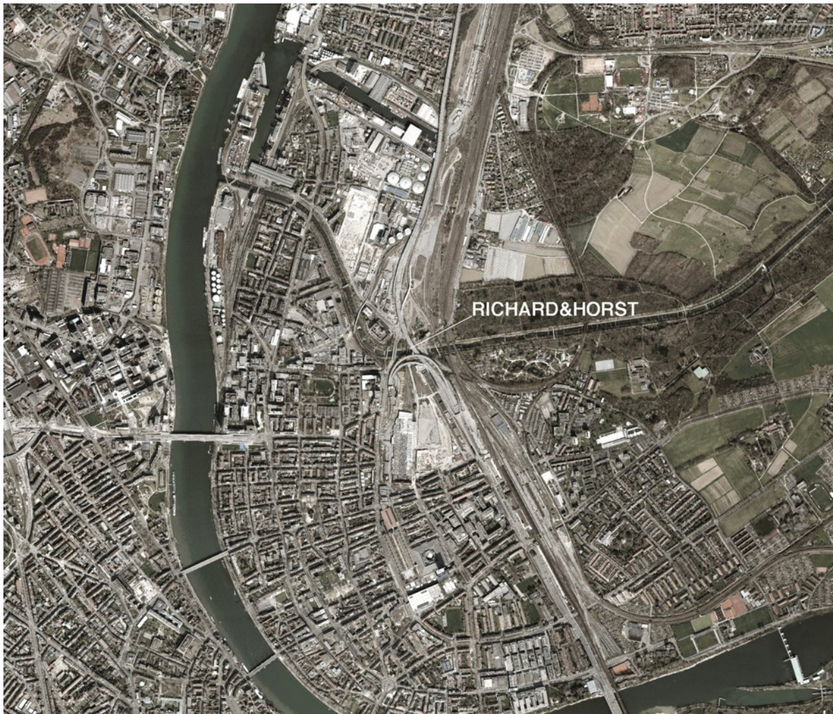
Orthofoto Ausschnitt nt Areal

Unser Ziel ist es, zwei dieser ungenutzten Eisenbahnbrücken „wiederzubeleben“ und kulturell umzunutzen. Geplant ist der Ausbau in den bestehenden statischen Unterbau der Stahlbrücken. In diese Kuben wird den Bewohnern der Erlenmatt, des Kleinbasels und weit darüber hinaus ein gastronomisches und kulturelles Erlebnis in einer schweizweit und vielleicht sogar international einzigartigen Lokalität angeboten. Eine solche Konstruktion ist nach Vorabklärungen mit einem Statiker grundsätzlich möglich, ohne dass dafür weitgehende Veränderungen an der Brückenarchitektur nötig wären. Diese soll soweit wie möglich in ihrem Originalzustand belassen werden. Der Ort soll nicht «umgestaltet», sondern viel mehr den Menschen zugänglich gemacht werden und ein historisches Kulturgut auf eine lebendige Art erhalten bleiben.